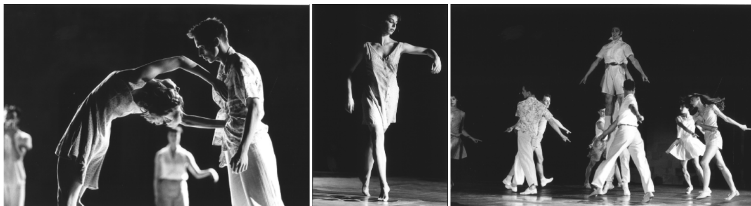
Necesito, 1991