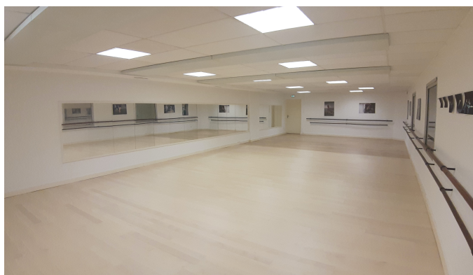
Salle blanche de 96 m 2