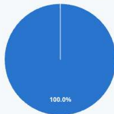
Chart options »

Lors de votre intervention, avez-vous pu transmettre le contenu initialement prévu ?