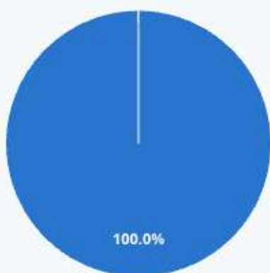
Chart options »