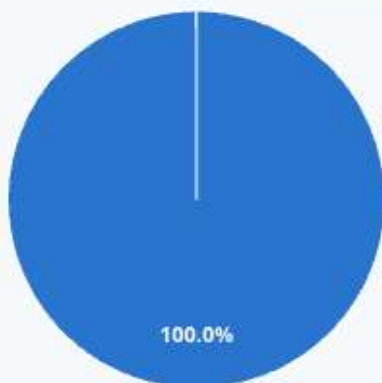
Chart options »

Lors de votre intervention, avez-vous pu transmettre le contenu initialement prévu ?